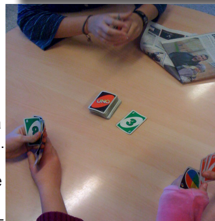
Bild 1 Lägerskolan för år 7 Bild 2 Uno spel på Nyfiket